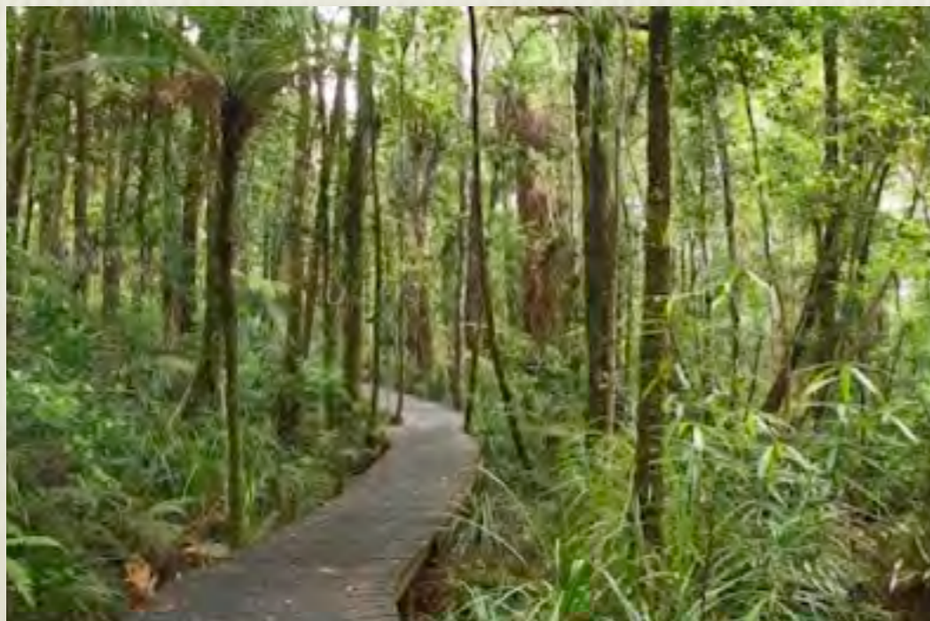
Trillos Area Común