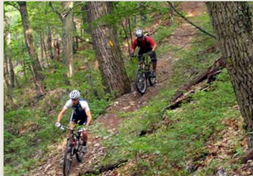
Bicicletas de Montaña