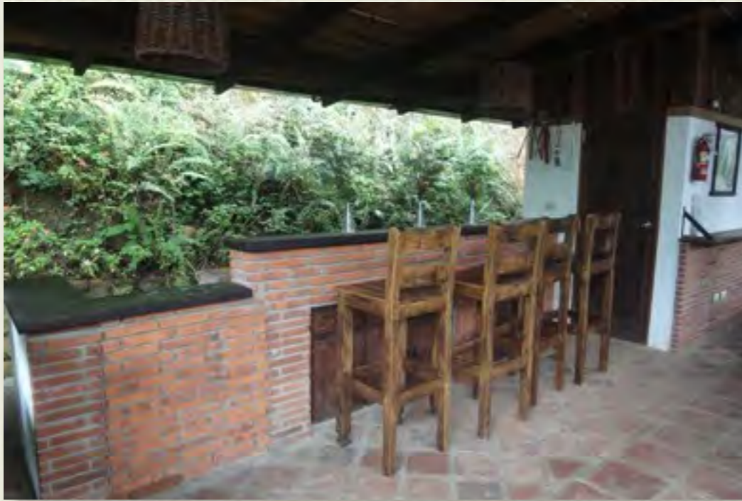
BBQ y Bar en Gazebo Area Común