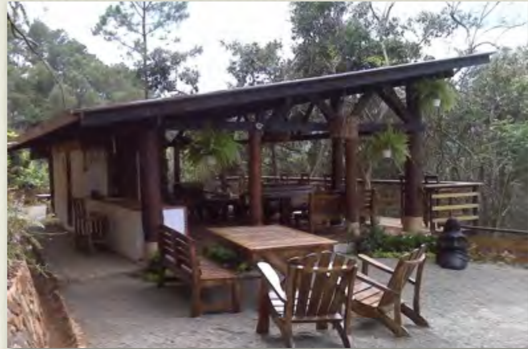
Gazebo Area Común