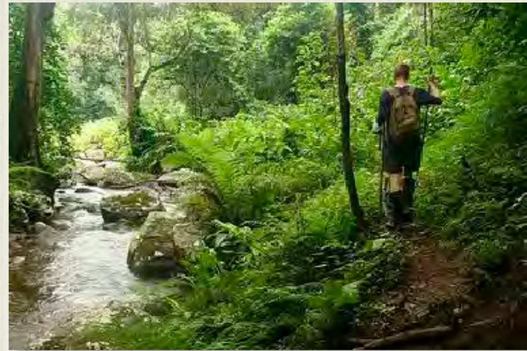
Caminatas por el Bosque Húmedo