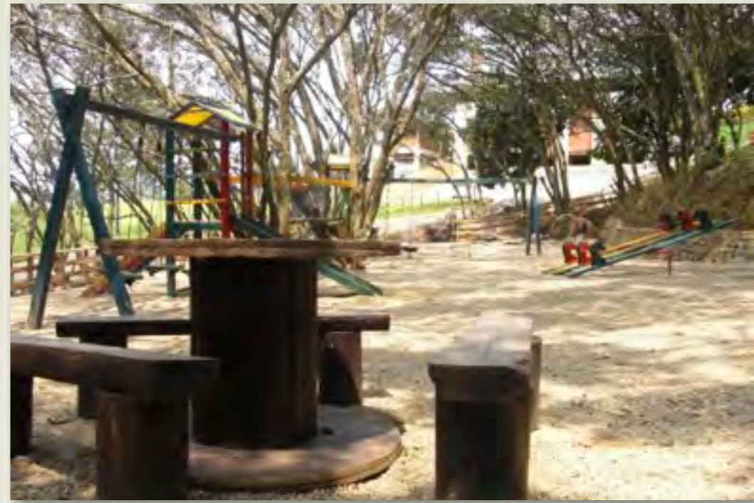
Area Juego de Niños