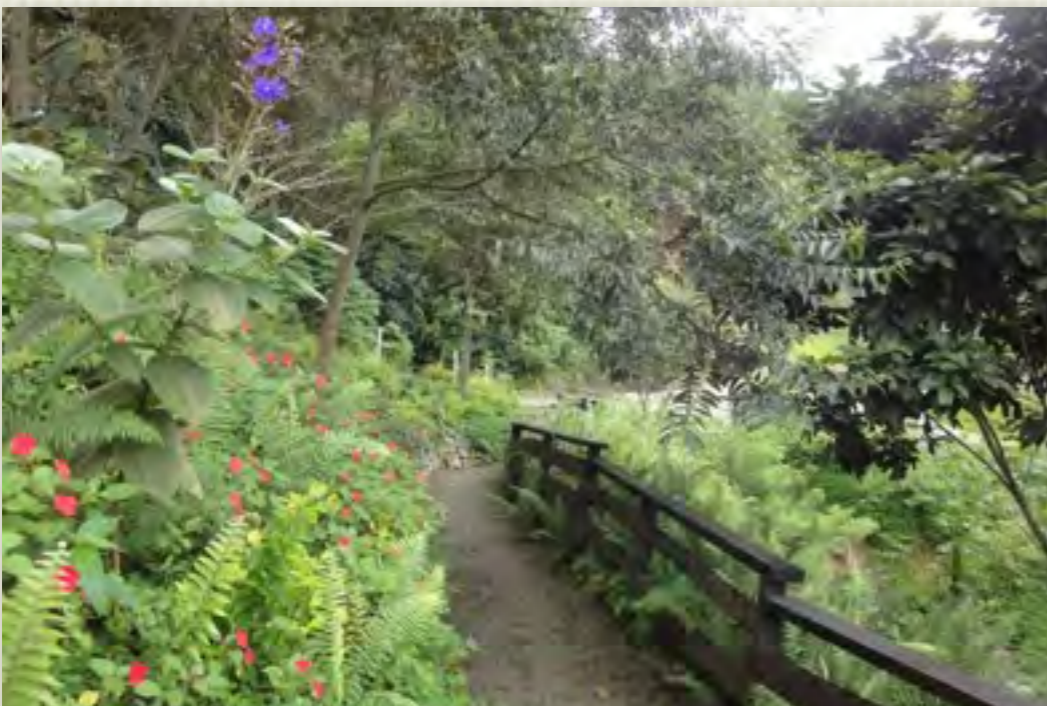
Trillos Area Común