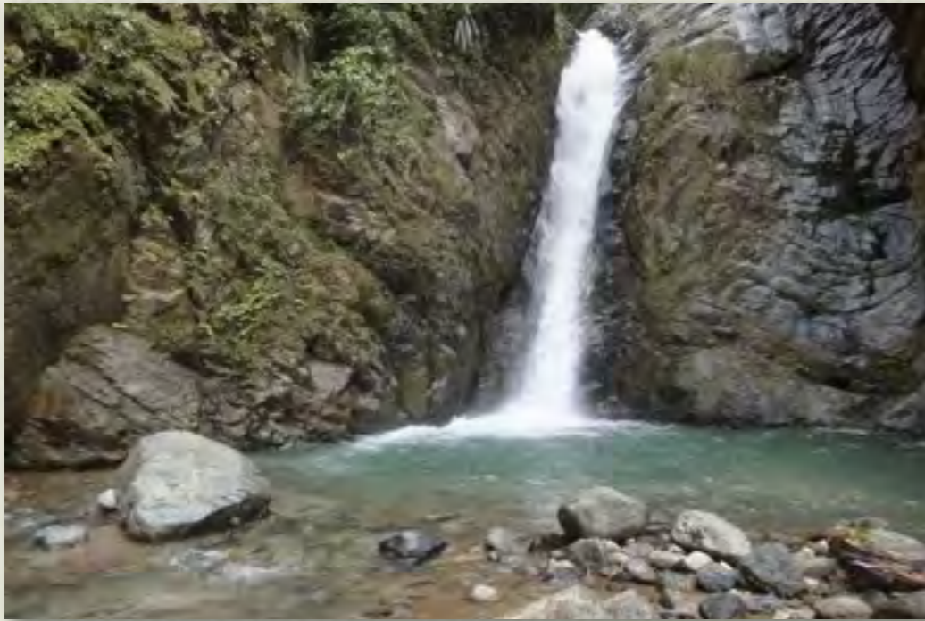
Salto de los Monjes (15 mt)