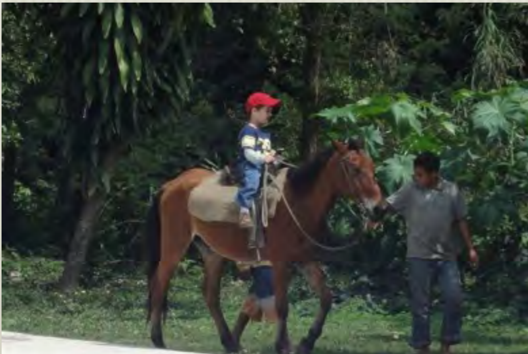
Paseos a Caballo