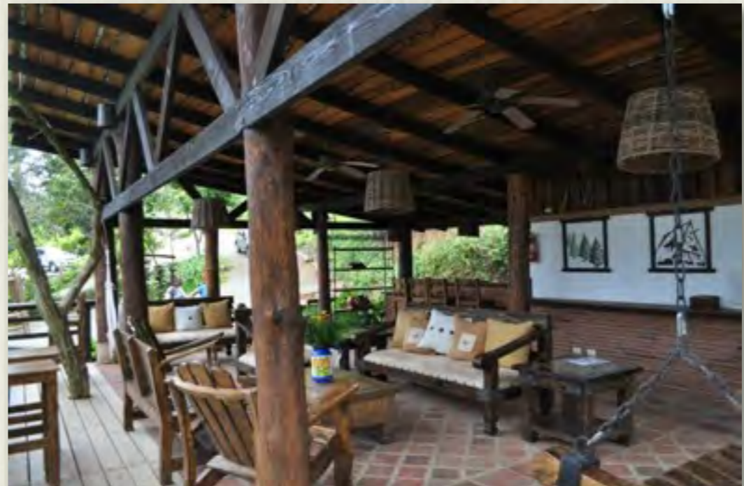
Gazebo Area Común