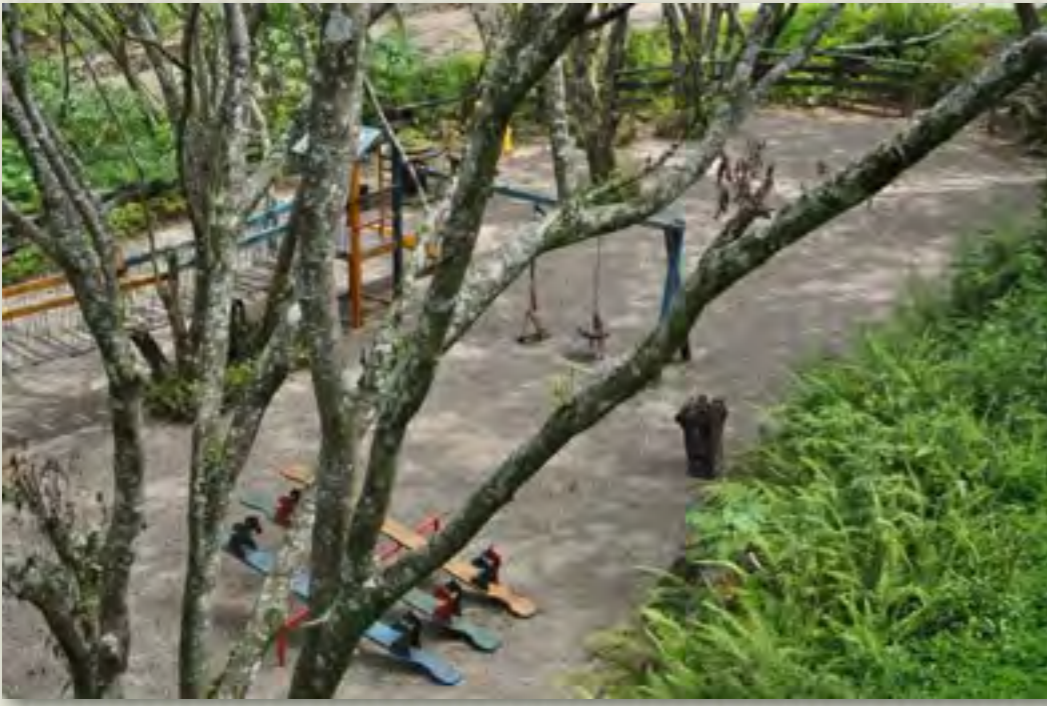
Area Juego de Niños